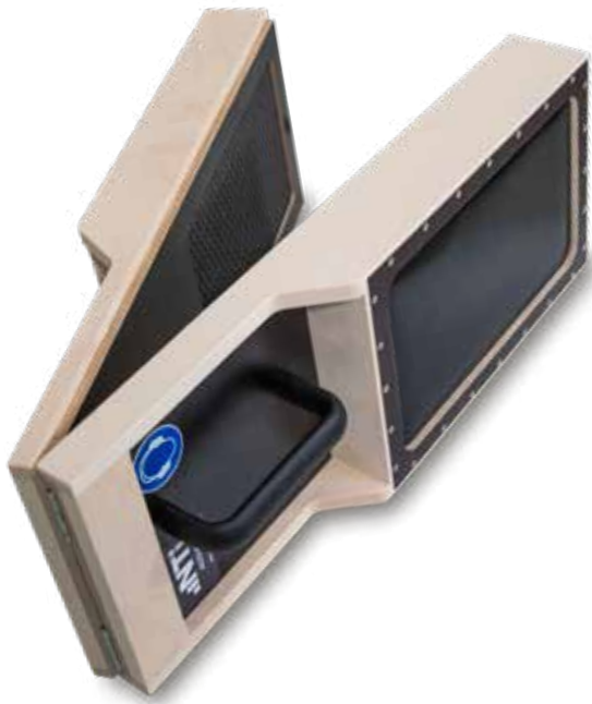
delta - 脉冲拍击器， 脉冲声源

Delta - 脉冲拍击器是一款易于使用的脉冲声源，适用于中小型空间的混响时间测量。