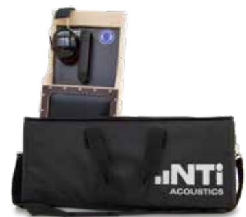
delta - 脉冲拍击器 (发货套装)